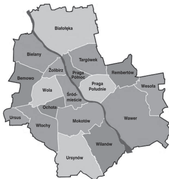
Rys. 1. Mapa dzielnic miasta Warszawy.

Niniejszą analizę przeprowadzono na przykładzie czterech oddziałów w Warszawie, którymi są: