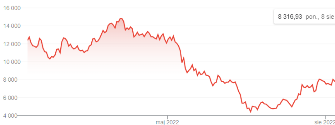
Wykres 2. Cena ether w okresie marzec–sierpień 2022